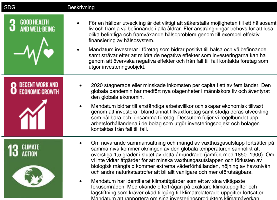
Tabell 1. FN:s mål för hållbar utveckling och beskrivningar.

Mandatum erkänner vikten av att tillämpa FN:s globala mål för hållbar utveckling (SDG) som ett verktyg för att styra investeringsprocessen. Mandatumkoncernen har fastställt följande SDG-mål som mest relevanta för sin verksamhet. Mandatums portföljförvaltning strävar efter att bidra positivt till dessa mål (beskrivs mer i detalj i tabell 1).